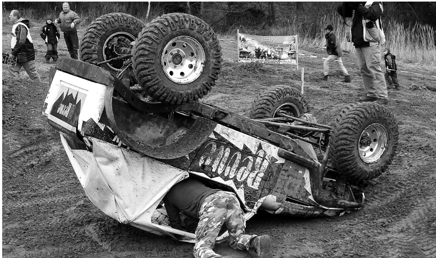
NEJEN WESTERN. V Šiklově mlýně se na tamní offroadové dráze pobaví i příznivci silných strojů.

„Letos plánujeme všechny atrakce spojit, takže návštěvníci mezi nimi budou přepravováni zvláštním autobusem. Z westernového městečka u Zvole, kde je nejvíce atrakcí a nejšířší program včetně zázemí a ubytování, se tak pohodlně dostanou do Dolní Rožinky. Tam mají možnost navštívit náš strašidelný zámek DraXmoor, nový Animal park, muzeum automobilových veteránů, ale i zrekonstruovaný statek, kde je možné si zajezdit na koních, nebo si jej jen prohlédnout. To celé