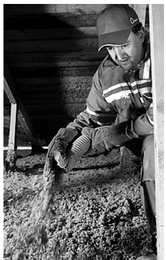
FOUKANÁ IZOLACE. V současné době je hitem syplá hmota, která se dostane všude.

Podle Makoviče je ze strany zákazníků největší zájem o specialitu vyráběnou právě jejich firmou. „Jde o náš vlastní systém, nazvaný Magmarelax, který komplexně zajišťuje nejen zatep-