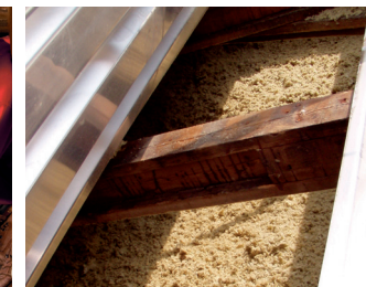
Zateplení střešy systémem MAGMARELAX®