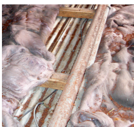
Nedokonalé pokrytí izolovaných ploch