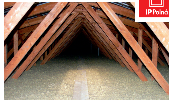
Zateplení systémem MAGMARELAX® ušetří často až 30% nákladů na vytápění.