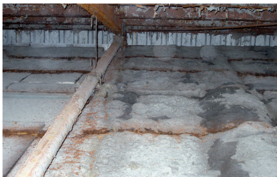
Zateplení půdních prostor starou skelnou vatou

je komplexní službou, v rámci které zhodnotíme stav izolace střešy objektu, haly, výkrmny nebo stáje, a navrhne optimální opatření k podstatné redukci letního přehřívání a zimních úniků tepla z objektu. Tento moderní systém obsahuje nejen poradenství, ale i projekt a dodávku minerální foukané izolace a vyřešení systému odvětrání.