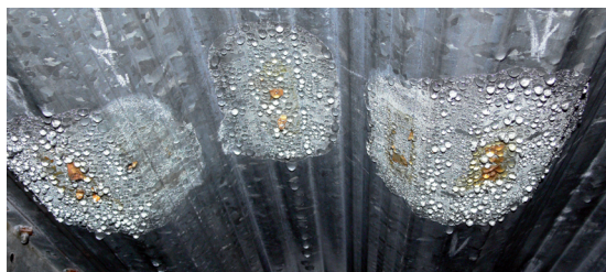
Koroze a degradace konstrukcí vlivem kondenzace vlhkosti