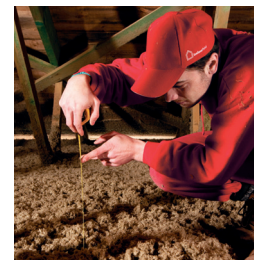
Kontrola výšky pokrytí izolací