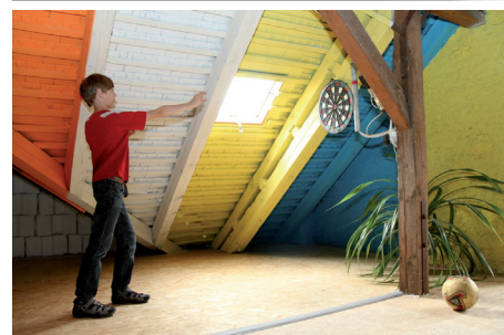
Bezpečný a veselý ráj pro děti