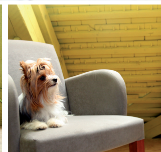
I vaši mazlíčci SWEET LOFT ocení