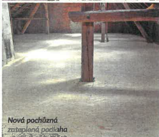
Nová pochůzná zateplená podlaha

S luneční paprsky nám zase ukázaly svoji sílu a hřejí a pálí do všeho, co jim stojí v cestě. Stejně jako my lidé se před nimi chráníme různými opalovacími krémy s různou silou faktoru, tak i naše příbytky by si rády ulevily od nesnesitelného horka.