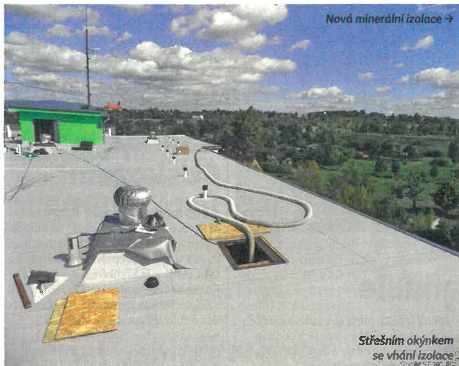
Nová minerální izolace →