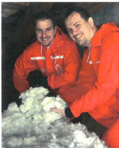
Minerální izolace MAGMARELAX® ECO

IP IZOLACE POLNÁ, s.r.o. tel.: +420 567 212 412 e-mail: info@ippolna.cz www.ippolna.cz