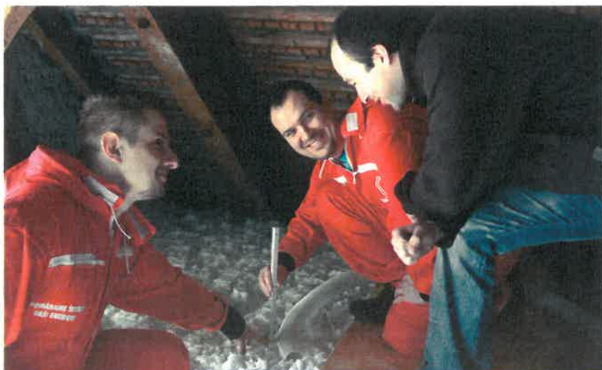
Pracovníci IP Polná ukazují zákazníkovi konečnou výšku izolace MAGMARELAX®