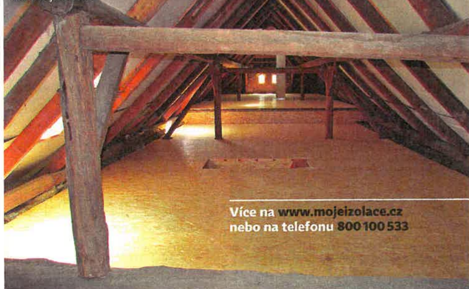
Podlaha jako nová

Více na www.mojeizolace.cz nebo na telefonu 800 100 533