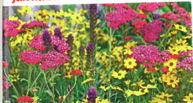
Suchomilné trvalky pro horké léto