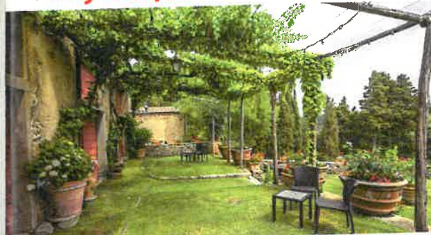
Jak na zahradní konstrukce