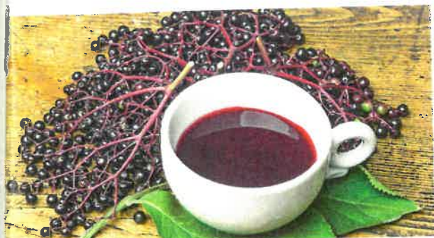
Černý bez pomůže s neduhy