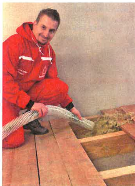
Vyplnění dutého stropu

a střechu dokonale zateplí. Jestliže máte nepřístupnou plochou střechu s vyšším sklonem (tzv. pultovou), doporučujeme vytvořit do ní vstupní otvor, vikýř.