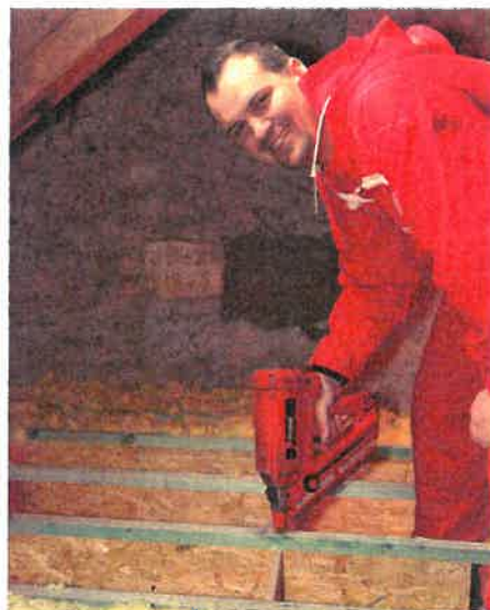
Pracovník IP Polná ukazuje základní rošt Stropního systému MAGMARELAX zafoukaný minerální izolací MAGMARELAX

Izolace stropu je doslova za hubičku: rychlá, vysoce účinná, nemusí se dělat omítky. Strop často tvoří velkou plochu domu, bylo by nerozumné, kdyby jím teplo zbytečně unikalo.