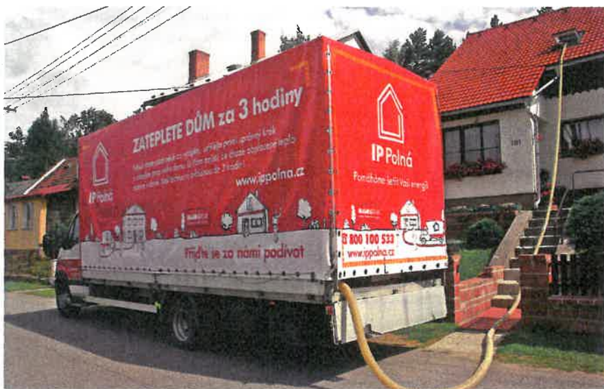
Auto, z kterého je izolace Magmarelax poháněna do domu

Teplo stoupá vzhůru a vždy si najde skulinku, kterou uteče ven. Způsobů zateplení je hodně. Jak to ale udělat, když nemáte moc peněz, a přesto byste chtěli, aby bylo zateplení účinné? Máme pro vás řešení a navíc snadné, rychlé a zcela bez starostí.